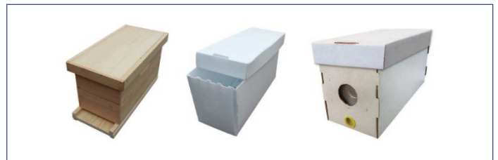
Figure 1. Options de boîtes à nucléi, de gauche à droite: une boîte en bois, une boîte en plastique, et une boîte de carton.

De plus, le nucléus devrait contenir des rayons vides pour permettre à la reine de pondre. Un nuc de 5 cadres peut aussi contenir un cadre de fondation pour fournir à la colonie, l'espace pour se développer.